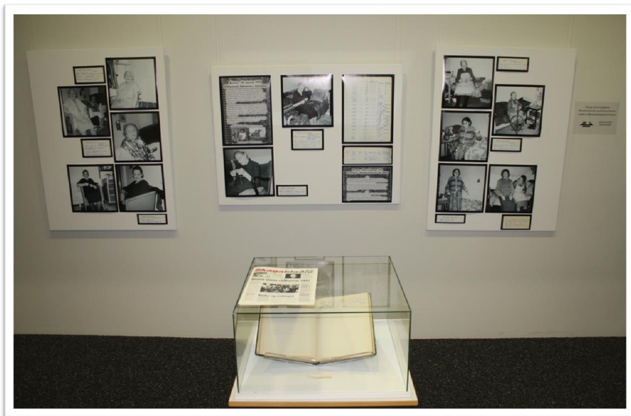
Konurnar í Arnardal. Sýning á veggnum að Dalbraut 1.